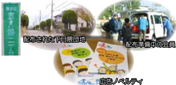
配布された下月隈団地

10月26日、午前10時から、下月隈団地で普及啓発促進活動の一環として広告ノベルティのポスティングを行ないました。委員長を初めとして、地域会員、事務所担当者等14人の会員が約500部をポスティングしました。土曜日でもあり散歩中の方もいて、説明を交えてのポスティングとなりました。