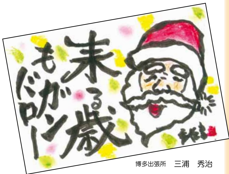
博多出張所 三浦 秀治