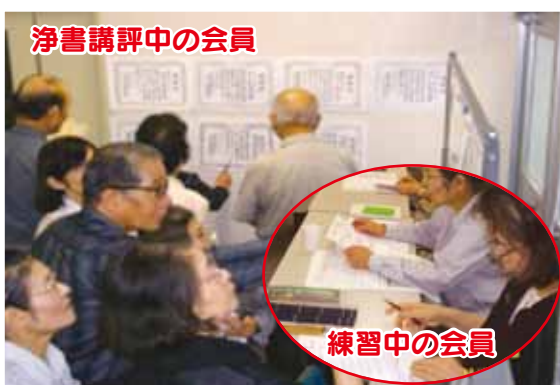
浄書講評中の会員