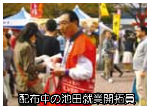
配布中の池田就業開拓員