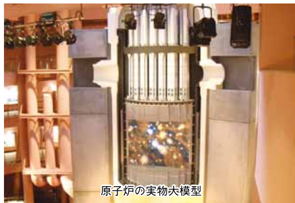
原子炉の実物大模型

ホテルレストランでは、イカの活造りや入浴、カラオケで楽しい時間を過ごしました。ひと休みして、玄海町の原子力発電所近くのエネルギーパークで、原子炉の実物大の模型を見学しながら原子力発電の説明を受けました。福島原発の事故以来、社会的話題になっている原発について、係員の説明に熱心に聴き入っていました。