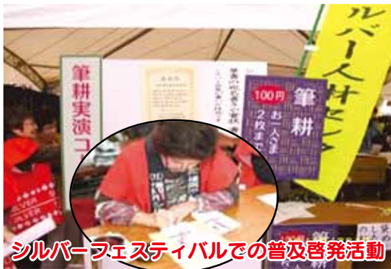
シルバーフェスティバルでの普及啓発活動