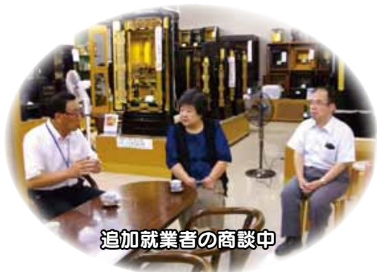
追加就業者の商談中

博多出張所の24年度の公共と民間の就業先の比率は約60対40です、これから民間の比率を高くしていくというのが博多出張所の指針でもあります。