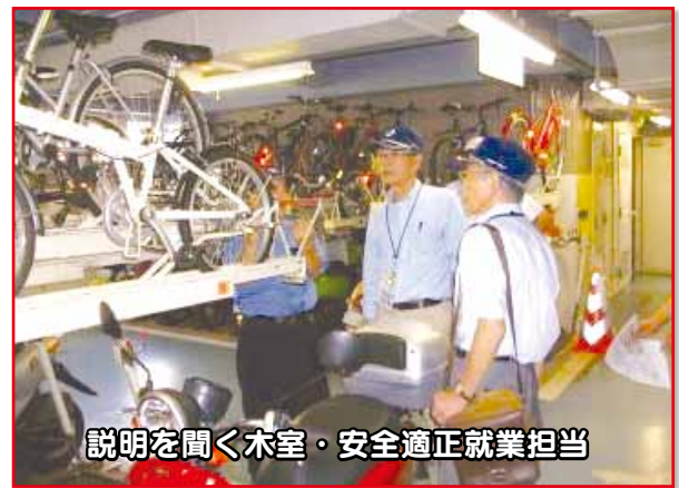
説明を聞く木室・安全適正就業担当